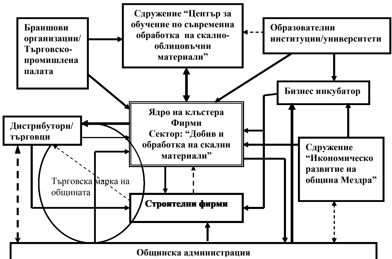
Стратегическа карта 1: клъстер „Скално-облицовъчни материали”

Резултатът от функционирането на клъстер на малките и средните предприятия дава възможност на предприятията да бъдат особен субект на пазара – стратегическа карта 2: клъстер „Малки и средни предприятия”. Стимул за създаване на клъстер между малките и средните предприятия е стремежа за решаване на общи проблеми, улесняване на маркетинговите и бизнес стратегии, облекчена логистика, търговската мрежа и увеличени възможности за въвеждане на иновативни решения в производството, в т.ч. нови модели на управление. Самостоятелното излизане на чужди пазари не е възможно за малките български фирми по много причини – липсват контакти, собствениците не знаят чужди езици, нямат капацитет да се изпълнят исканите количества и други. Създаването на клъстери се явява ефективен начин да се противопоставят на конкуренцията и да оцелеят. Освен това работата в екип и партньорство неминуемо водят до повишаване на качеството на продукцията, защото ако един се провали, целият клъстер се проваля. Клъстерът улеснява логистиката за западния контрагент. Плюсоевете на това окрупняване са, че фирмите се специализират в някаква дейност и това им дава възможност да отговорят в срок независимо от големия обем на поръчката.