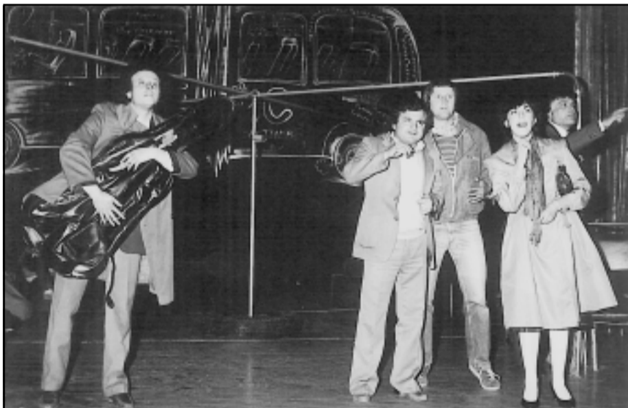
Премиера на мездренска сцена на пиесата "Рейс" от Станислав Стратиев (режисьор: Юли Пухалски, сезон 1985/86/87).

хроникьор на събитията, случващи се около нас. Именно заради тези ти качества, а и по повод твоята статия в бр. 22/ 2010 г. на в. "Мездра XXI век" "Празниците на културата: една традиция с бъдеще", в която с изумление открих съществени пропуски, реших, че съм длъжен да направя някои допълнения, които ще са от полза и за теб самия.