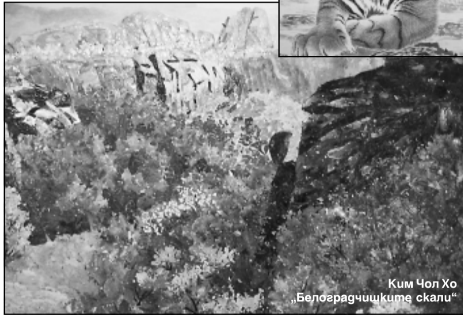
Ким Чол Хо „Белоградишките скали“

ната свежест" художествена техника "манненхва" - вид мозайка от морски раковини, седеф и мигени черупки, съчетаващи елементи от приложното и изобразителното изку-