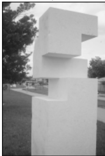
"Колона" - Красимир МИТОВ