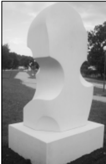
"Въображение" - Моника ИГАРЕНСКА