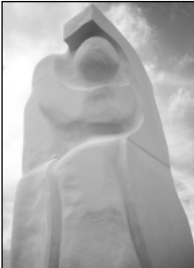
"Аз и ти" - Цветанка КОЙКОВА