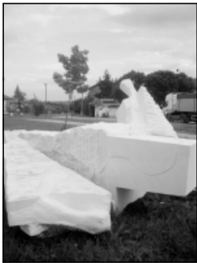
"Отломки от мечта" - Кирил МАТЕЕВ