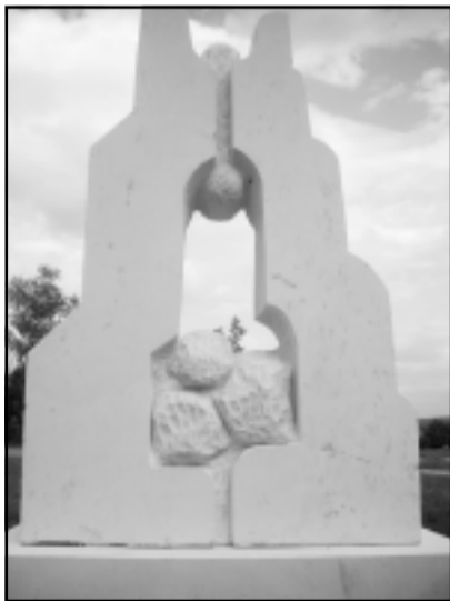
"Утроба" - Теодор ДЪСКОТЛИЕВ