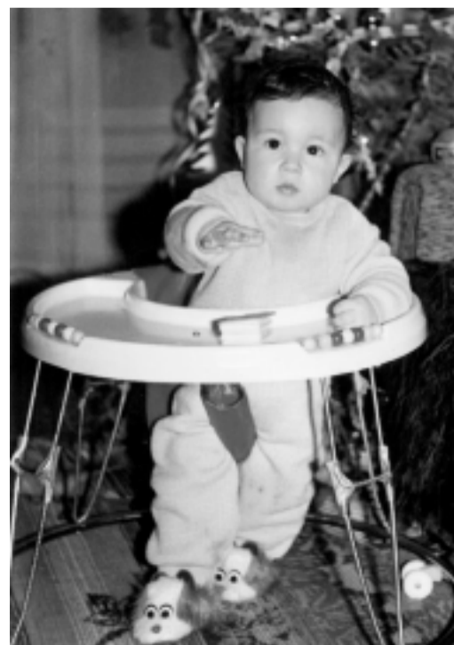
КРАСИ - 1 годинка