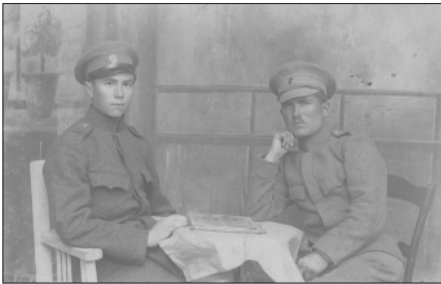
Участници в Първата световна война 1915 - 1918 г. от с. Елисейна

И тя поема решително по нелекия път. Привежда в изрядност библиотечния фонд от над 10 000 тома книги, подрежда етнографска сбирка към читалището, събира наличната документация. Междувре-