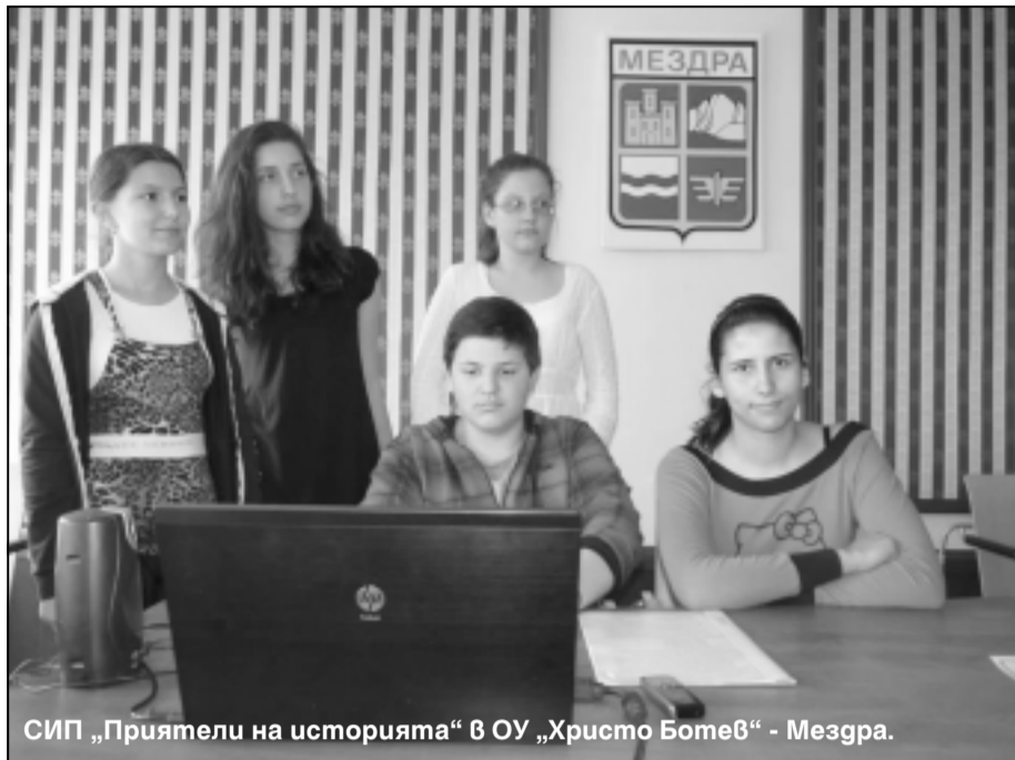
СИП „Приятели на историята“ в ОУ „Христо Ботев“ - Мездра.