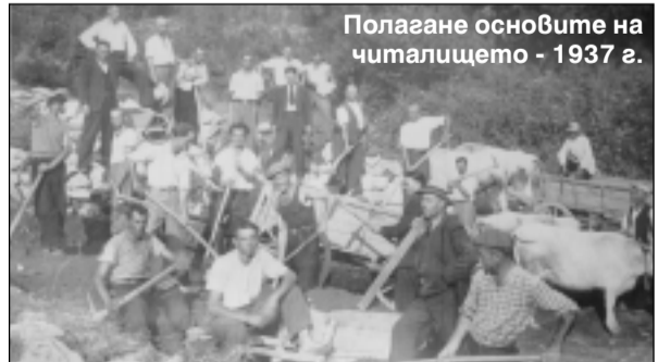
Пологане основите на читалището - 1937 г.

Три години по-късно, на 20.IX.1899 г., популярното „типченско театро“ поставя Вазовата пиеса „Руска“, като единствената женска роля се изпълнява от Атанас Петков. Именно тази дата се счита за рождена на читалището.