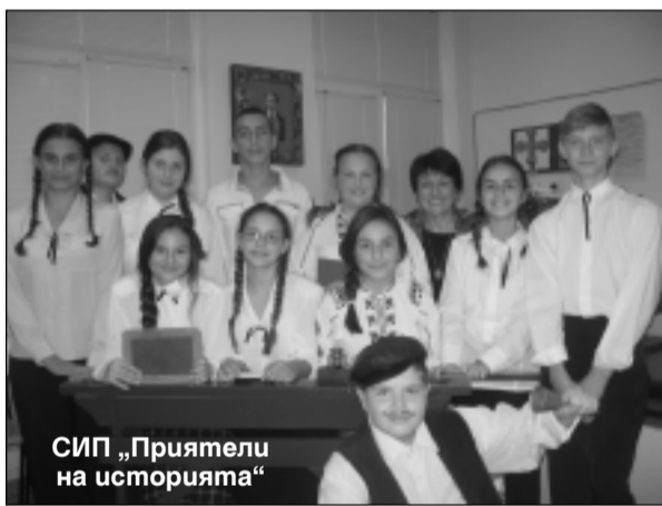
СИП „Приятелите на историята“

На един от най-българските празници в календара бе посветен и откритият урок под