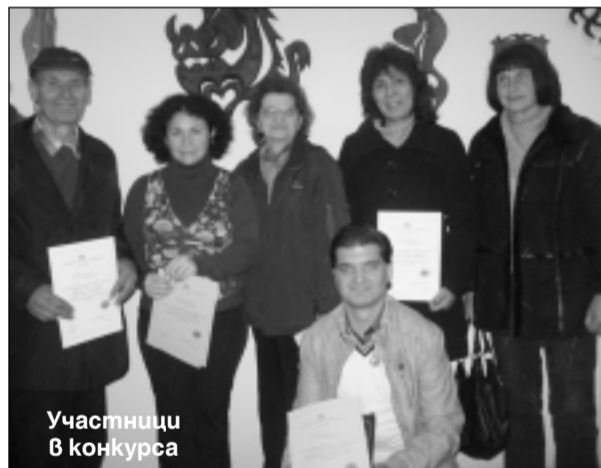
Участници в конкурса

турен конкурс за есе „Не се гаси туй, що не гасне“ , организиран от НЧ „Просвета 1925“. В него се включиха девет автори от различни поколения. Техните творби оцени жури с председател Валентин Вълчев , председател на Читалищното настоятелство.