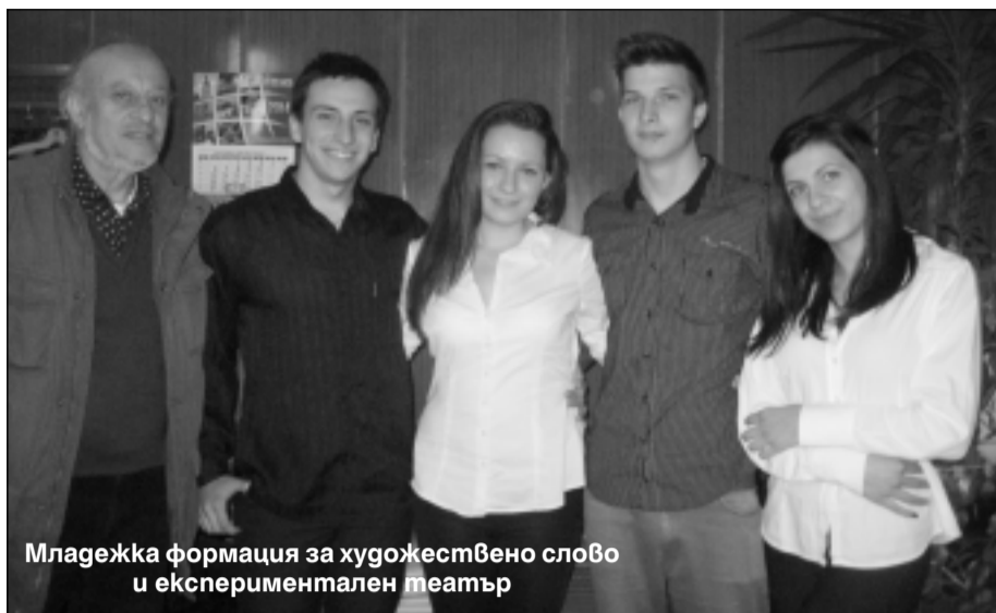
Младежка формация за художествено слово и експериментален театър

И тази година мездренското читалище „Просвета“ отбеляза по подобаващ начин Деня на народните будители - 1 ноември , отдавайки почит към непроходното дело на плеядата знайни и незнайни книжовници, просветители и революционери, допринесли за съхраняването на българския национален дух.