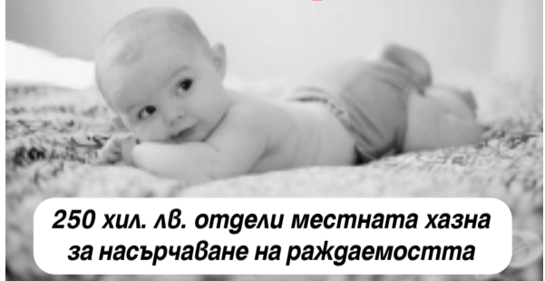
250 хил. лв. отдели местната хазна за насърчаване на раждаемостта

60 новородени през първото шестмесечие на т. г. получиха в началото на юли еднократна парична помощ от Община Мездра. За целта местната хазна отдели 16 500 лв., с които бяха стимулирани родилките, подали молба в установения срок. За първо дете размерът на помощта е 350 лв., за второ - 300 лв., за трето - 100 лв., като близнаците са равнопоставени.