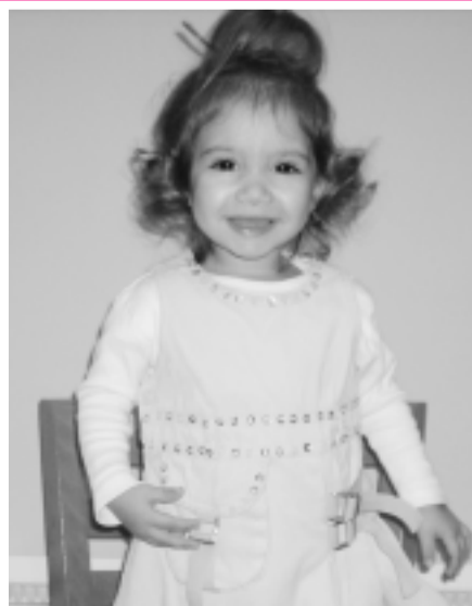
ИВАЙЛА - 2 годинку