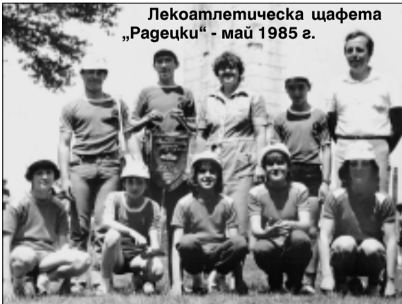
Лекоатлетическа щафета „Рагецки“ - май 1985 г.

растват десетки републикански шампиони в спринта, скоковете на дължина и височина, многобоя, средните,