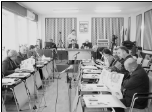
Общински съвет - Мездра: момент от първата сесия на местния парламент през 2011 г.