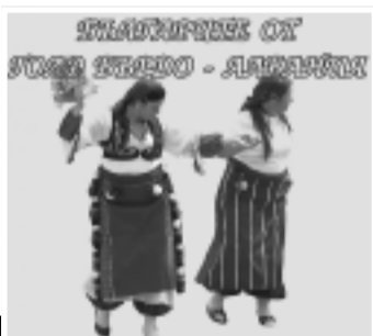
Национален музей "Земята и хората": откриване на фотоизложба "Българи от Голо Бардо, Албания"