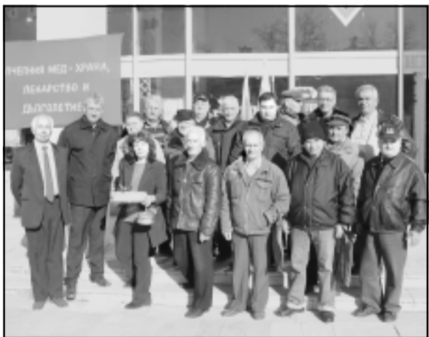
Изложба-базар "Пчеларство'2011" по повод празника на пчеларите - Деня на св. Харалампий (10 февруари)