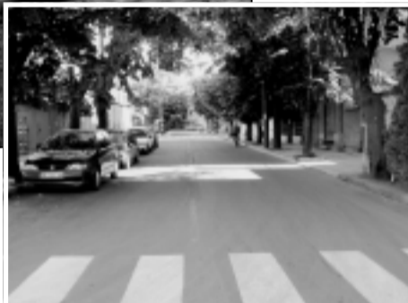
боядисани, а пънната маркировка - очертана. Обновената улица прави

Сменени са бордюрите, 3-метровите тротоари са засплатени с бетонни плочи, засадени са цветарници. Направени са подходи за инвалиди и майки с деца към тротоарите на съседните улици и площада. Осемметровото платно е нивелирано и асфалтирано, бордюрите са